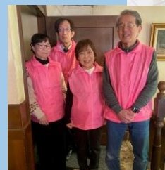
労働者協同組合 グリーンクルー